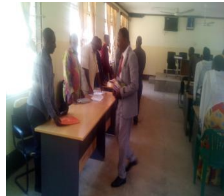
Mkurugenzi mteule aliye vaa suti na tie nyekundu akisalimiana na watumishi baada kukabidhiwa ofisi katika ukumbi wa halmashauri.

Huku akiwaasa wananchi kufanya kazi kwa uadilifu na pia kuacha kufanya kazi kwa mazoea kwani kufanya hivyo ni kosa na si utaratibu kwa mtumishi wa umma, hivyo kila mmoja ni sharti kuzingatia kanuni na taratibu za utimishi katika utekelezaji wa majukumu yake.