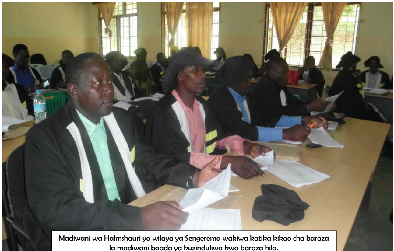
Madiwani wa Halmshauri ya wilaya ya Sengerema wakiwa katika kikao cha baraza la madiwani baada ya kuzinduliwa kwa baraza hilo.

Huku wakiahidi kutoa huduma bora kwa wananchi ili kukidhi mataajia yao na serikali kwa ujumla jambo ambalo siku za hapo nyuma ilionekana maadili kushuka na hivyo viongozi kujiona miungu mtu na si wawakilishi wao.