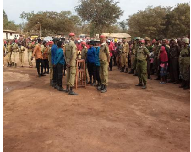
KUTOKA KUSHOTO NI MAAFISA WA SEIKALI WAKISHANGILIA MWENGE WA UHURU KWA MADAHA KATIKA ENEO LA KAMANGA WAKISINDIKIZWA NA VIJANA KUTOKA JESHI LA MGAMBO, SKAUT PAMOJA NA JESHI LA POLISI